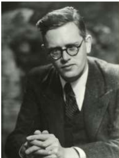
uit: portrettengalerij DG Groningen (1946-1949)