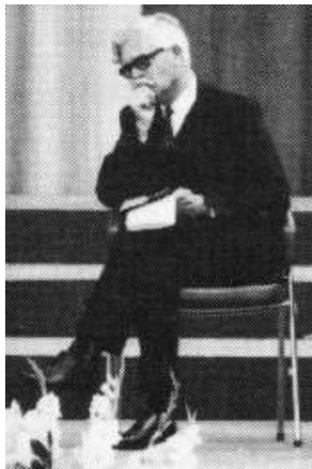
op Doopsgezind Wereldcongres, Amsterdam 1967