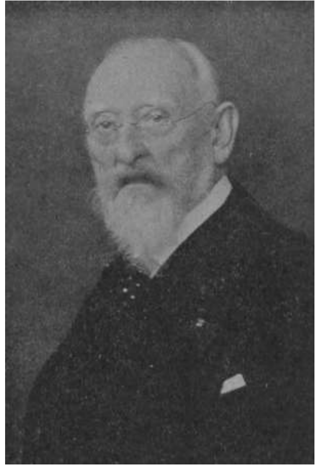
uit: De Zondagsbode Jg. 43, nr. 51, p. 220; 19-10-1930, t.g.v 80 ste verjaardag [delpher]