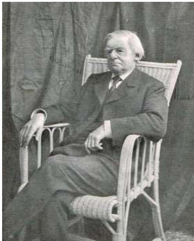
uit: Doopsgezind Jaarboekje 1916 , frontispice scan: beeldbank AllardPierson [uvaerfgoed]